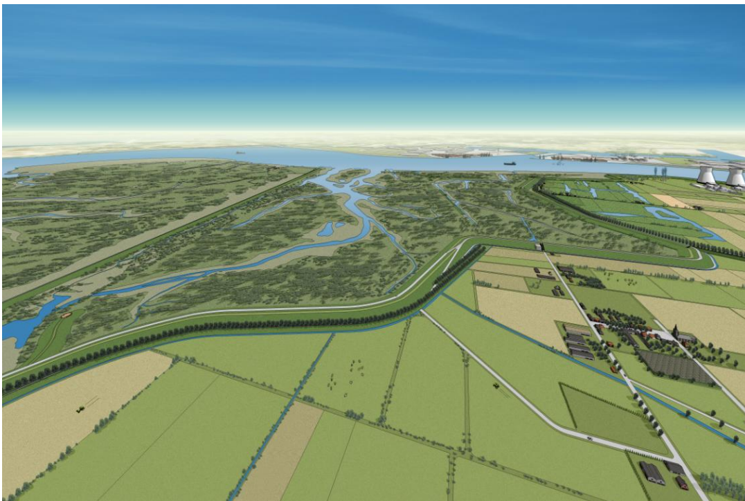
Artist-impression in vogelvlucht van de Hedwige- en Prosperpolder na ontpollering