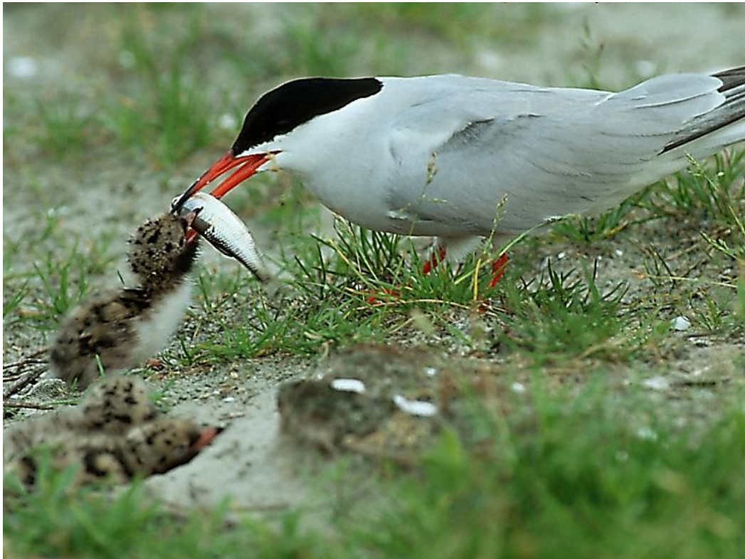
Visdiefje met jongen: broedvogel van de ontpolderde Hedwigepolder?

hand in hand bij ontpoldering. De volgende foto's en schetsen geven een idee over hoe de Hedwigepolder er over een paar jaar kan uitzien.