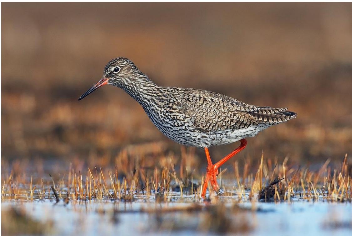
Na ontpoldering zal de tureluur de Hedwigepolder waarschijnlijk snel koloniseren.