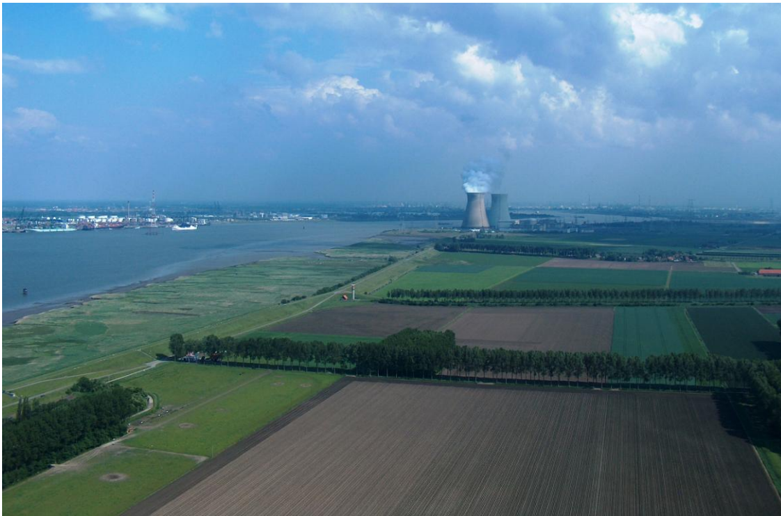
Akkerbouw in de Hedwigepolder met op de achtergrond de haven van Antwerpen

Het realiseren van nieuwe estuariene natuur ten behoeve van het behoud van bedreigde soorten vogels, planten en dieren en hun leefgebieden in het Schelde-estuarium, door extra ruimte maken voor water (getij-invoed) en het daarmee bevorderen van het natuurlijk evenwicht in het estuarium.