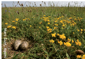
Marc Guyt, Agami

De scholekster legt zijn 3-4 eieren in een ondiep kuiltje. Na ongeveer 25 dagen komen de eieren uit.