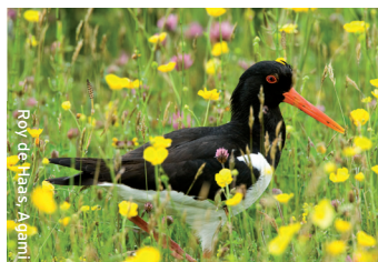
Roy de Haas, Agami

Scholeksters broeden graag in vochtig, kruidrijk grasland, in kort begraasde weilanden en op bouwland. Voorafgaand aan het jaar van vestiging inspecteren scholeksters potentiële broedgebieden door in de broedtijd verschillende gebieden te bezoeken. Scholeksters broeden pas op 3 à 4 jarige leeftijd. Dan vestigen ze zich op een geschikte locatie. Ze zijn vervolgens erg plaatstrouw.