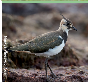
Marinus Vreeswijk, Agami

Kuikens zijn in het veld te vinden tussen begin april tot eind juli; deze laatste kuikens zullen meestal afkomstig zijn van vervolglegrels.