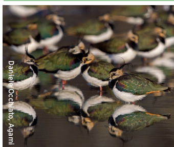
Danielle Occhialo, Agami

Na het broedseizoen verzamelen kieviten zich in groepen, inclusief de vliegvlugge jongen, en foerageren ze in vochtige graslanden. Hier eten ze onder andere emelten. De volwassen vogels ruien dan. De najaarstrek start vanaf september. Rond deze tijd arriveren ook kieviten uit de landen ten noordoosten van ons. Ze vormen gezamenlijke groepen die de vorstgrens zullen volgen.