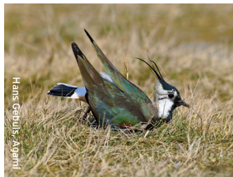
Hans Gebuis, Aarni

De kievitman komt eerst terug en vestigt zijn territorium, met imposante baltsvluchten. Kievitvrouwen gebruiken de strootjes uit strotorijke vaste mest voor hun nest. Ook is vaste mest goed voor insecten en het bodemleven. Kievitvrouwen broeden liefst op vochtige graslanden met een korte (grazige) vegetatie. Ook broeden ze vaak op maispercelen; aangrenzende vochtige graslanden zijn dan nodig om voedsel te zoeken.