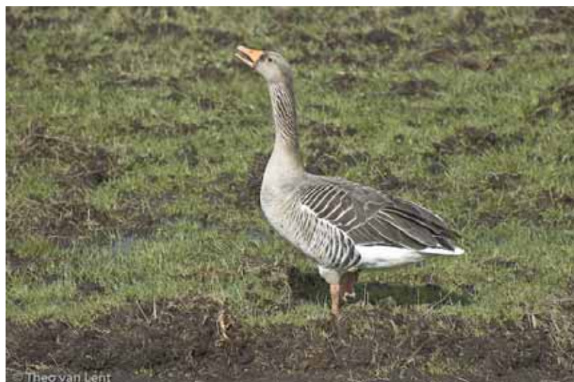
Grauwe gans.