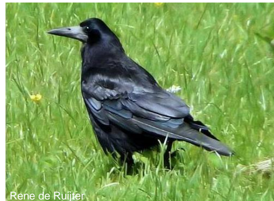
Rene de Ruijter

Roeken zijn in Nederland zowel standvogel als trekvogel. De volwassen dieren blijven het hele jaar in ons land terwijl de jonge vogels naar Engeland trekken. Er overwinteren